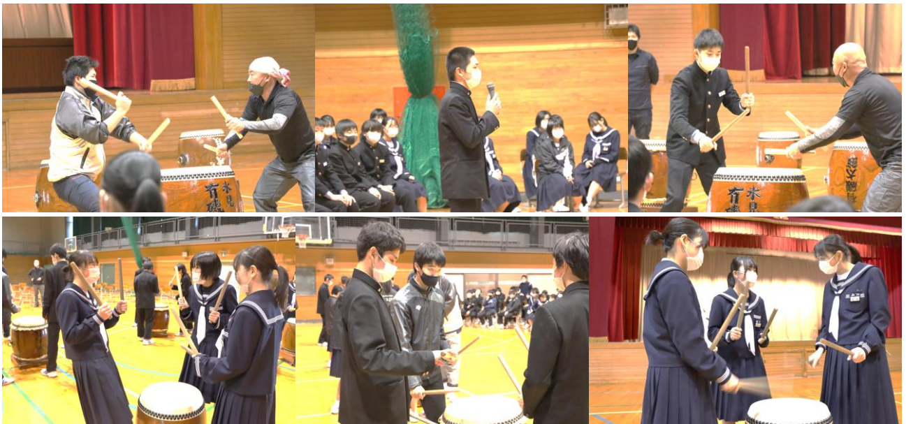
有磯太鼓鑑賞・体験会