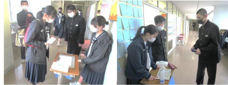
保健委員 手洗いチェック