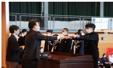
生徒会役員任命式

生活規律委員長 I (3-3) 交通安全委員長 M (3-2) 保健委員長 H (3-1) 美化委員長 T (3-3) 文化委員長 H (3-3) 図書委員長 N (3-2) 体育委員長 N (3-2) 給食委員長 K (3-2) ボランティア委員長 T (3-3) 栽培委員長 M (3-3) 学力向上委員長 O (3-2) 放送委員長 Y (3-2)