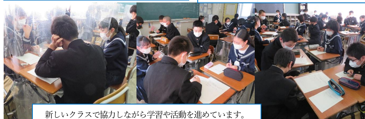
新しいクラスで協力しながら学習や活動を進めています。