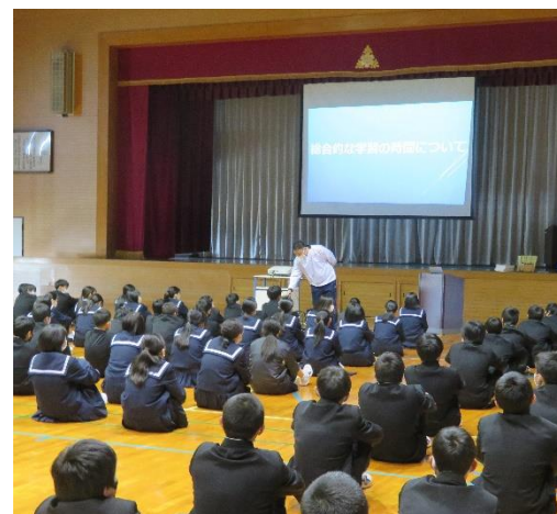
14歳の挑戦に向けて氷見の魅力を考えました。