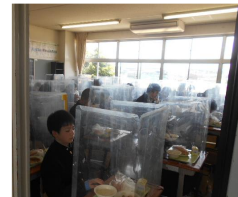
感染対策を徹底しながら給食を楽しんでいます。