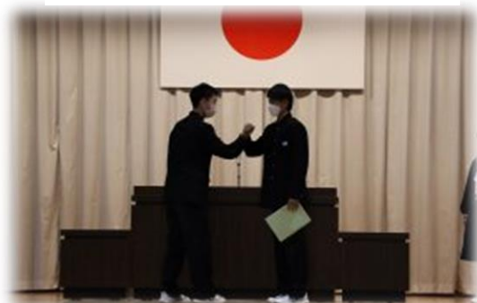
前期生徒会退任式・引継式