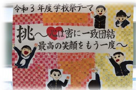
学校祭 モニュメント