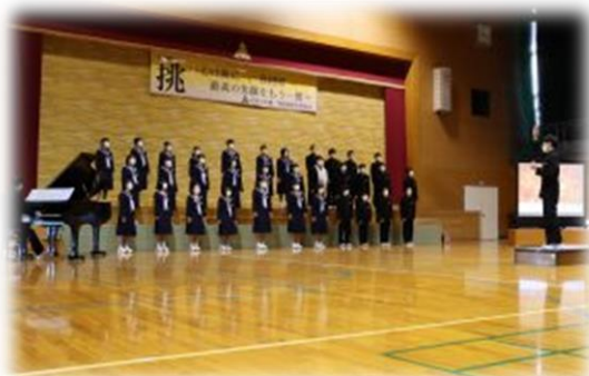
2 年 3 組