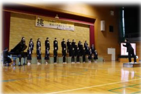
3 年 1 組