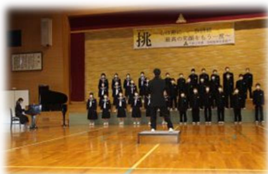
1 年 3 組