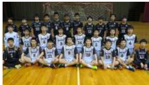
第15回春の全国中学生ハンドボール選手権大会 ふれあいスポーツセンター他 3月25日(水)～29日(日)