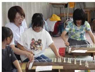
地域の方とともに ～クラブ活動～