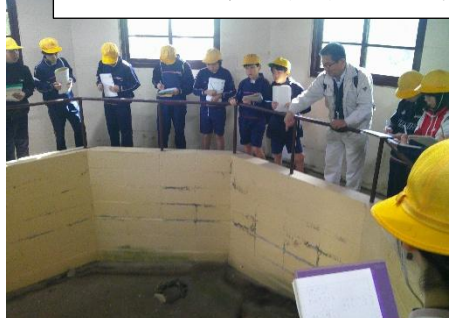
歴史ツアー（朝日貝塚、阿尾城跡）

早いもので今年も残りあと一月となりました。そして、卒業までのカウントダウンカレンダーを掲示するようになりました。「卒業まであと〇日」という言葉で、一日一日を大切にしていきたいと改めて思うようになりました。中学校に向けて学習のまとめをしたり、仲間との思い出を作ったりしていきたいと思います。よろしくお願いいたします。