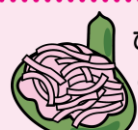
ひちぎり きょうとふ (京都府)