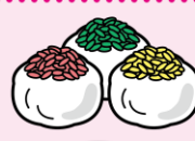
いがまんじゅう あいちけんにしみかわちいき (愛知県西三河地域)