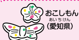
おこしもん あいちけん (愛知県)