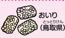
おいり とっとりけん (鳥取県)