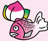
きんかとう いしかわけんかなざわし (石川県金沢市)