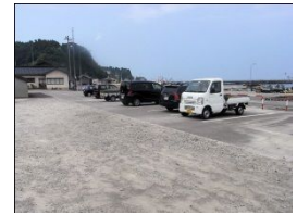
駐車車両が多いため、見通しが悪い。