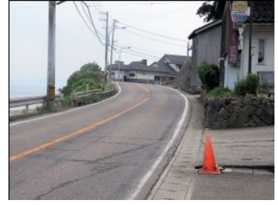
急カーブで見通しが悪く、自動車が見えにくい。