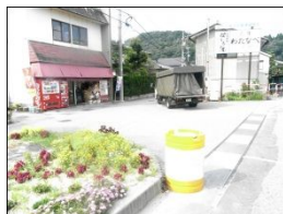
トラックが止まっていることが多く、見通しが悪い。