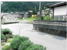
家の塀があるため、見通しが悪い。