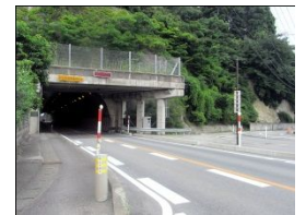
道幅が狭く、歩道が途中でなくなる。