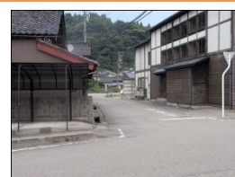
一旦停止になっているが、見通しが悪く、危険。