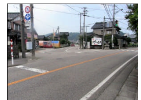
五叉路になっており、 自動車から歩行者が 認知されにくい。