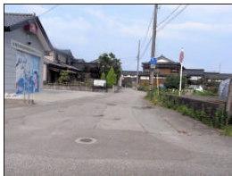
道幅が狭いが、自動 車はスピードを出し ている。