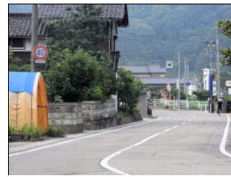
S字カーブになって いて見通しが悪い。