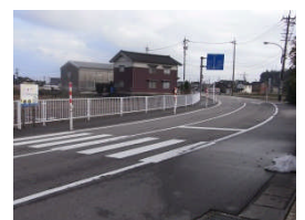
学校前横断歩道 カーブの直後に横断 歩道があり、死角に なっていて危険。