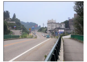
国道 160 号線で自動 車のスピードが速い。