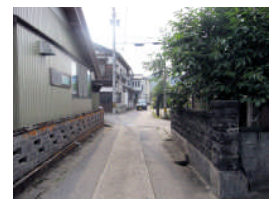
道幅の狭い交差点に なっており、飛び出 し注意。