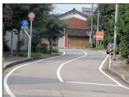
冬場に積雪で歩道が無 くなり、危険。