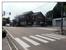
死角が多く、交通量 が多いので、危険。