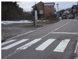
学校前横断歩道 カーブの直後に横断 歩道があり、死角に