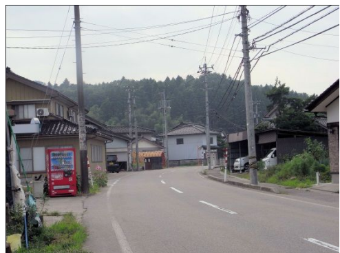
カーブが二段階になって曲がっており、見通しが悪い。