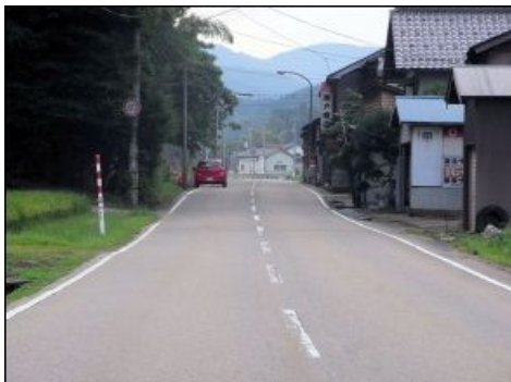
道路がまっすぐなため、自動車はスピードを出しがちになるが、路側帯が狭く危険。