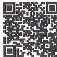
連絡メール2 保護者登録